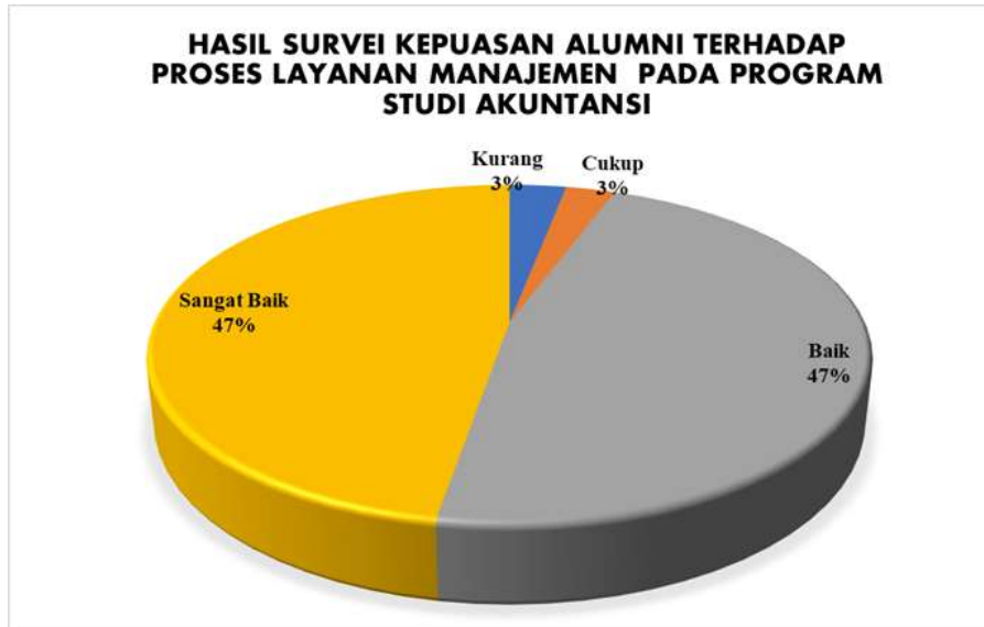
Diagram 4.1 Persentase Hasil Survei Kepuasan Alumni terhadap Proses Layanan Manajemen pada Program Studi Manajemen

Berdasarkan hasil survei dapat dilihat pada Diagram 4.1 yang menggambarkan bahwa secara keseluruhan mahasiswa program studi Manajemen memberikan nilai Sangat Baik sejumlah 47%, nilai Baik sejumlah 47%, nilai Cukup sejumlah 3%, nilai kurang 3%. Jika merujuk pada Tabel 2.3 nilai persentase tersebut berada pada rentang 41-60%, sehingga dapat disimpulkan bahwa kepuasan alumni terhadap proses layanan manajemen di program studi Manajemen masuk pada kategori CUKUP BAIK .